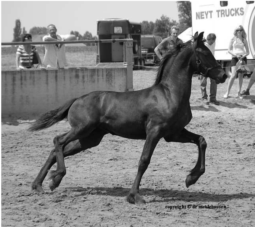
Ineke Ut Lembeke (Haitse 425 Stb Sport x Wibe 402)