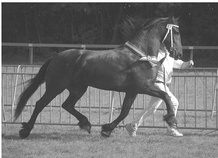
Samme L. van Stal Linde (Mintse 384 Sport x Bonne 341)

Dans les rubriques d'admission des chevaux plus jeunes, la qualité était suffisante, mais plusieurs chevaux avaient du mal à montrer un bon pas. Les juments plus âgées étaient des chevaux avec beaucoup d'expression de race, bien bâties et pour la majorité puissantes dans leurs allures.